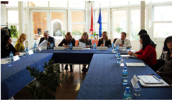
Gjatë zhvillimit të workshopit me temë “Mbikëqyrja dhe rregullimi i tregjeve të letrave me vlerë dhe fondeve të investimeve në Shqipëri”